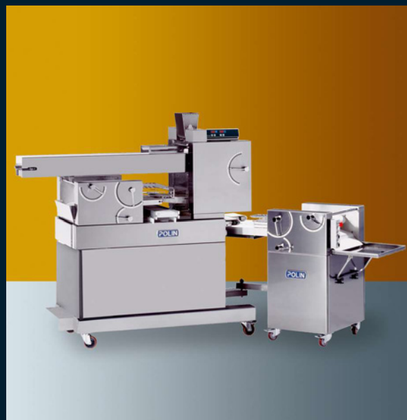
2 rows 2 vie - 2 voies - 2 filas