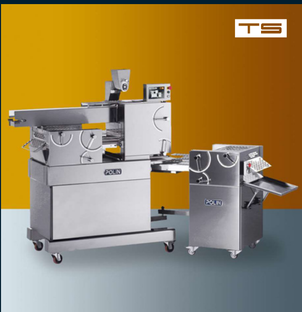
1 row 1 via - 1 voie - 1 fila