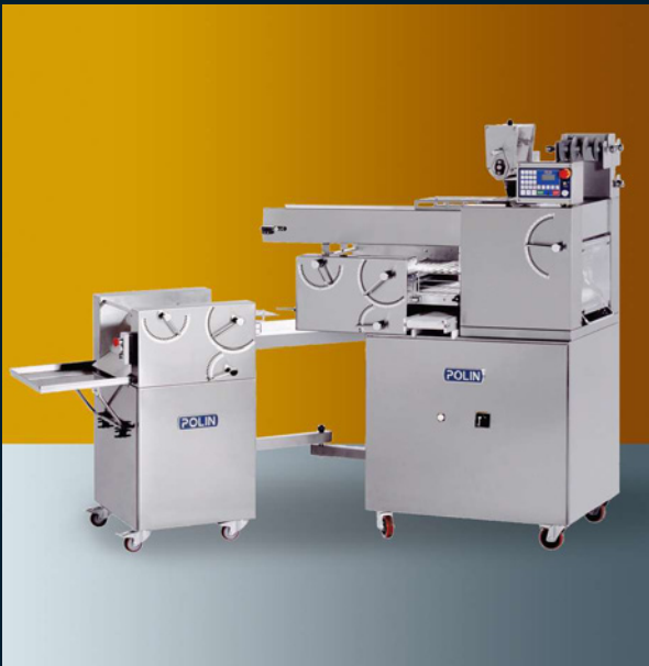
1 row 1 via - 1 voie - 1 fila