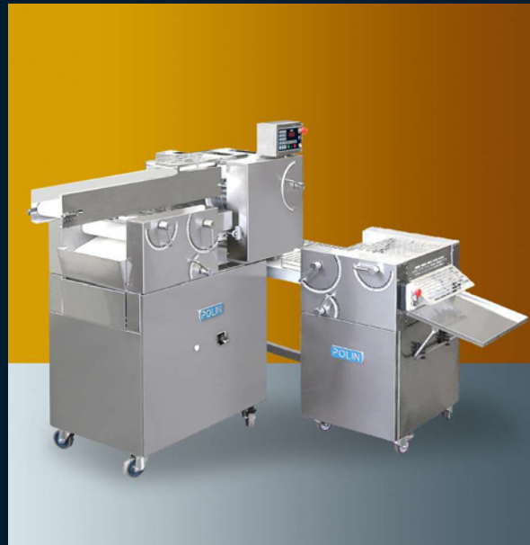
1 row 1 via - 1 voie - 1 fila