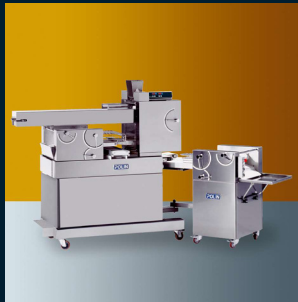
2 rows 2 vie - 2 voies - 2 filas