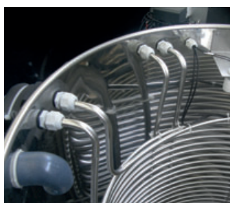
Serbatoio accumulo ed evaporatore a serpentina in acciaio inox