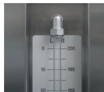
Indicatore di livello a doppia scala