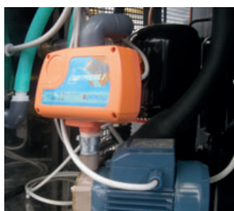
Pressoflussostato elettronico per l'erogazione acqua refrigerata