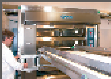
1 Prelevare la pasta cotta Remove the cooked dough

INFORMAZIONE: 1 minuto - LOADING / minute