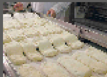
2 Trasferire la pasta cotta sul nastro Transfer the cooked dough to the conveyor