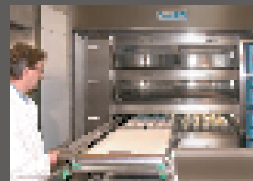
3 Inserire la pasta cotta nella camera Insert the cooked dough into the oven