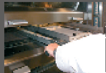
4 Prelevare la pasta cotta dal nastro Remove the cooked dough from the conveyor